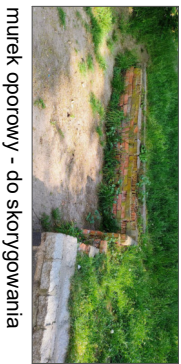
murk oporowy - do skorygowania